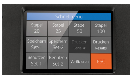
Hochauflösendem Touchscreen mit mehrsprachiger Benutzeroberfläche und Schnellmenü