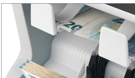
identifiziert Banknoten, die nicht für den Umlauf oder Ihren Geldautomaten geeignet sind