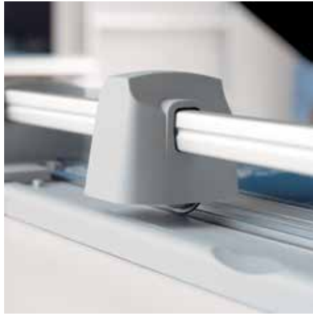
Geschlossener Messerkopf für eine sichere Bedienung der Schneidemaschine