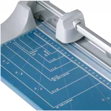
Praktische Formatlinien erleichtern die Ausrichtung des Schnittgutes