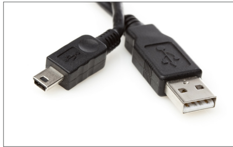
Safescan USB Update-Kabel Art. no: 112-0459